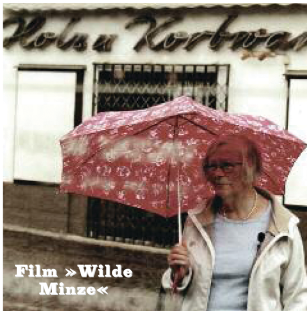
Film »Wilde Minze«